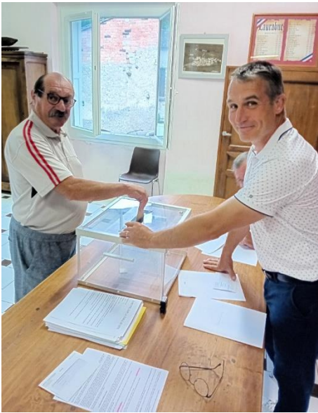
VOTE DU MATIN