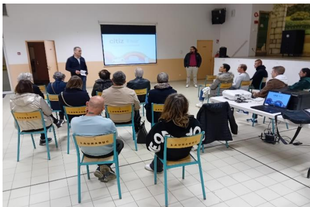
Présentation de l'offre spéciale *Laurabuc* à l'occasion des 6 mois d'autopartage.